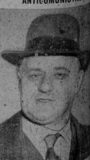
Arthur Deakin, jefe de la Federación de obreros de Inglaterra, que próximo se trasladará a los Estados Unidos para discutir la fundación de una Federación internacional comunista con los administradores y sindicatos americanos.

LA FORMACION DE UNA FEDERACION INTERNACIONAL DE OBREROS ANTICOMUNISTAS