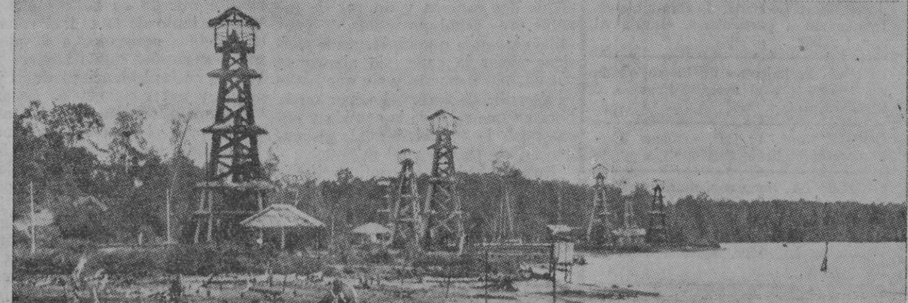
Arriba: Una vista de Medan, la ciudad más importante de Sumatra. Abajo: Un campo petrolífero en Pangkajene Soesoe, situado a setenta kilómetros de Medan

Batavia, 21 (1 t.).—Aviones holandeses han bombardeado objetivos de Jogjakarta en el curso de su ofensiva contra la República indonesia, según han informado dos subditos norteamericanos que acaban de evacuar la capital republicana. Uno de ellos manifestó que la lucha en las calles, cuando las tropas holandesas aerotransportadas entraron en Jogjakarta, duró media hora.—Efe.