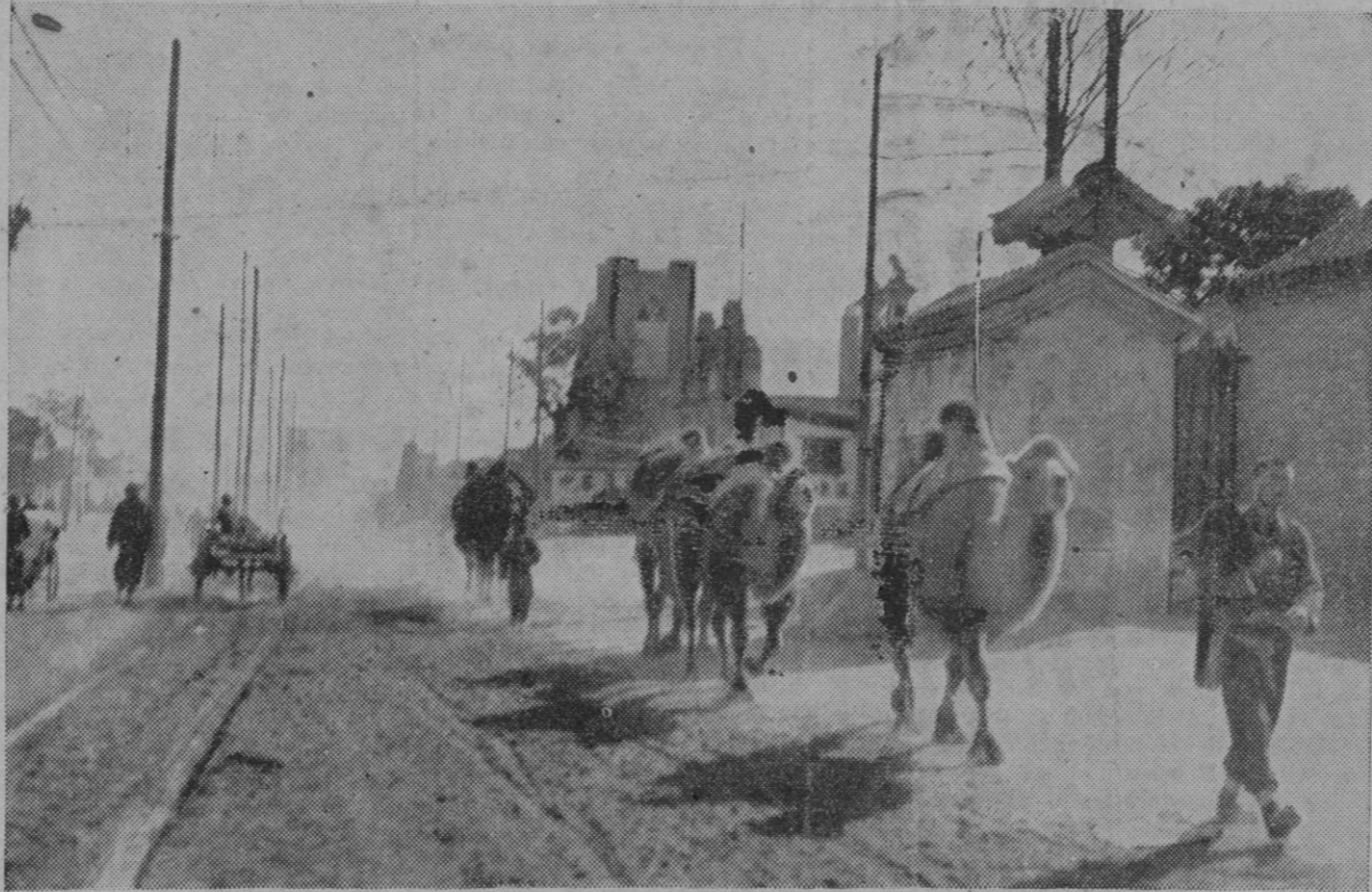
Una sección de camelleros gubernamentales chinos dirigiéndose al frente, a su paso por un camino de las afueras de Peiping (Pekín), antigua capital de China, en cuyos suburbios se encuentran los rojos