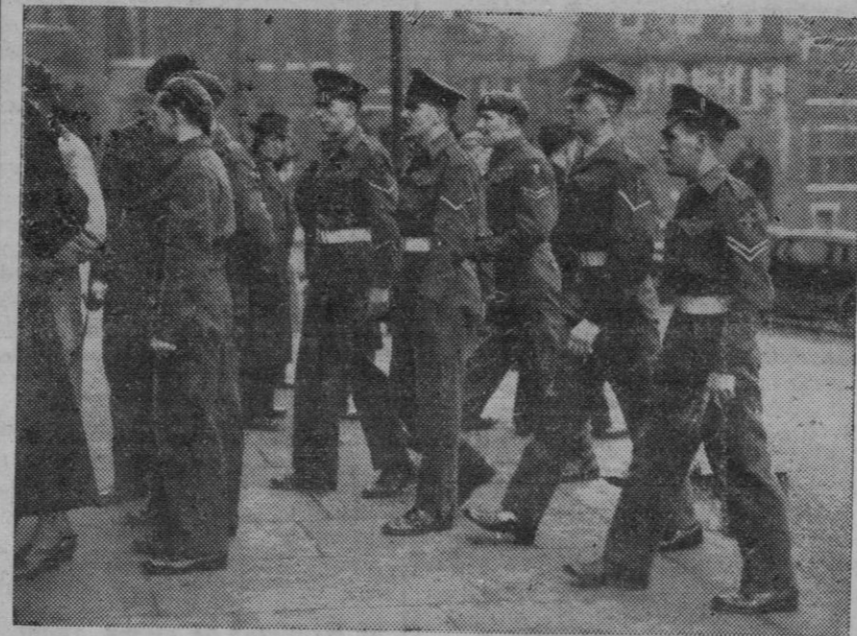
Los instructores de la Policía militar han dispuesto que los agentes más jóvenes asistan a la vista del proceso por irregularidades en varios departamentos ministeriales

Ha dimitido el secretario parlamentario de Comercio