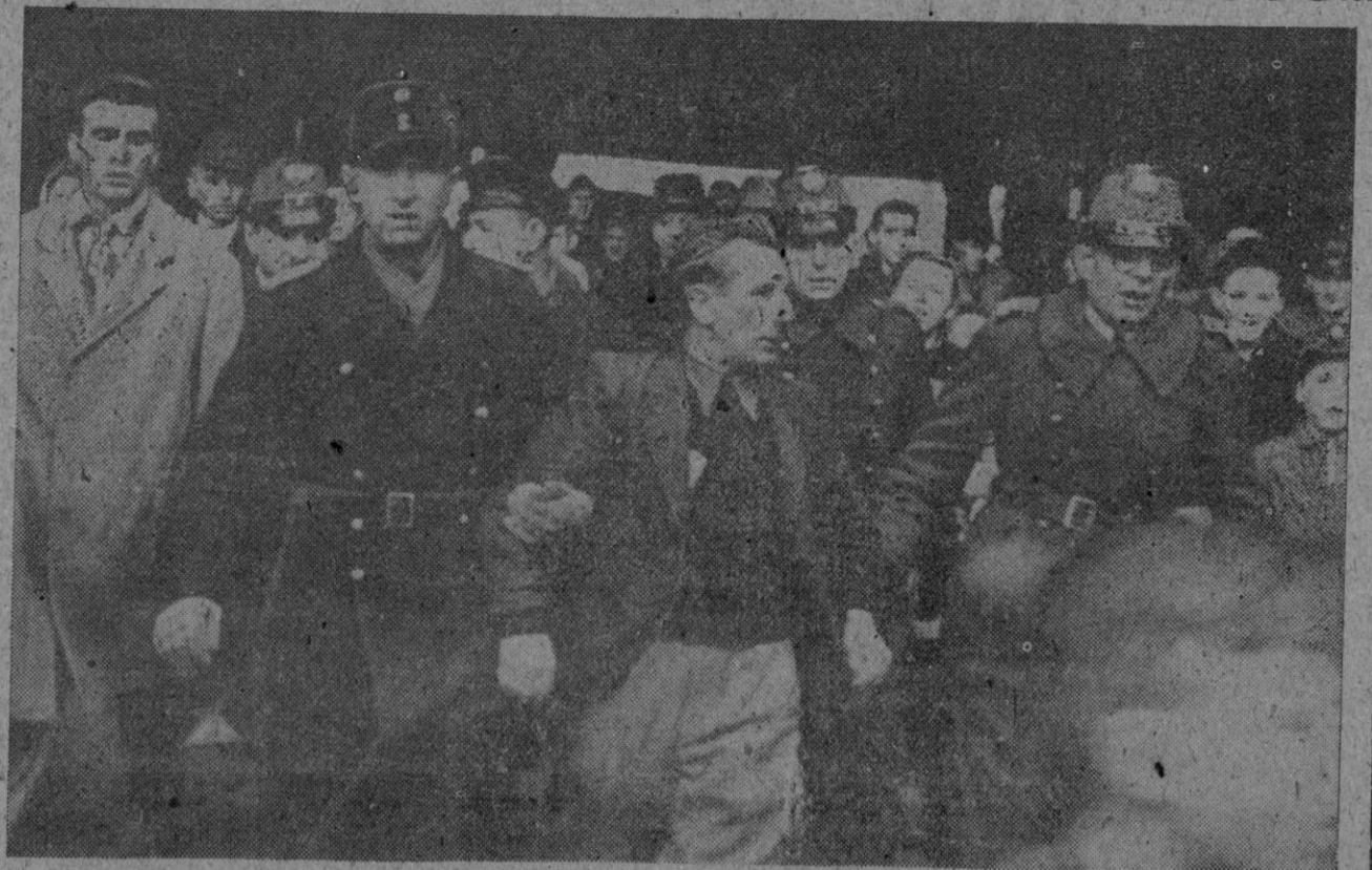
En el sector ruso de Berlín, ese el alemán que va conduciendo por la policía cometió la "imprudencia" de hablar con desdén de los soviets. Un individuo comunista dió el soplo a las autoridades soviéticas, los rojillos se congregaron en el lugar del "suceso", y el todo us ofrece esta estampa del espectáculo democrático al estilo moscovita