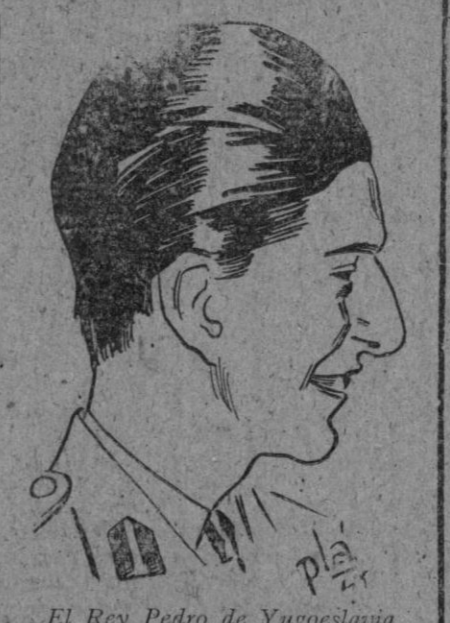
El Rey Pedro de Yugoslavia

Washington, 9 (6 t.)—El embajador de los Estados Unidos en Italia ha manifestado que este país dependerá de sí mismo para 1951, con tal de que para entonces se haya producido la reconstrucción general europea.—Efe.