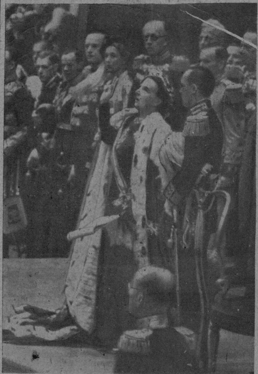
Solemne momento en que la nueva Reina de Holanda, acompañada del Príncipe consorte, Bernardo de Lippe, que aparece, de uniforme, a la derecha de la Soberana, jura la Constitución del Estado ante los parlamentarios reunidos en Amsterdam