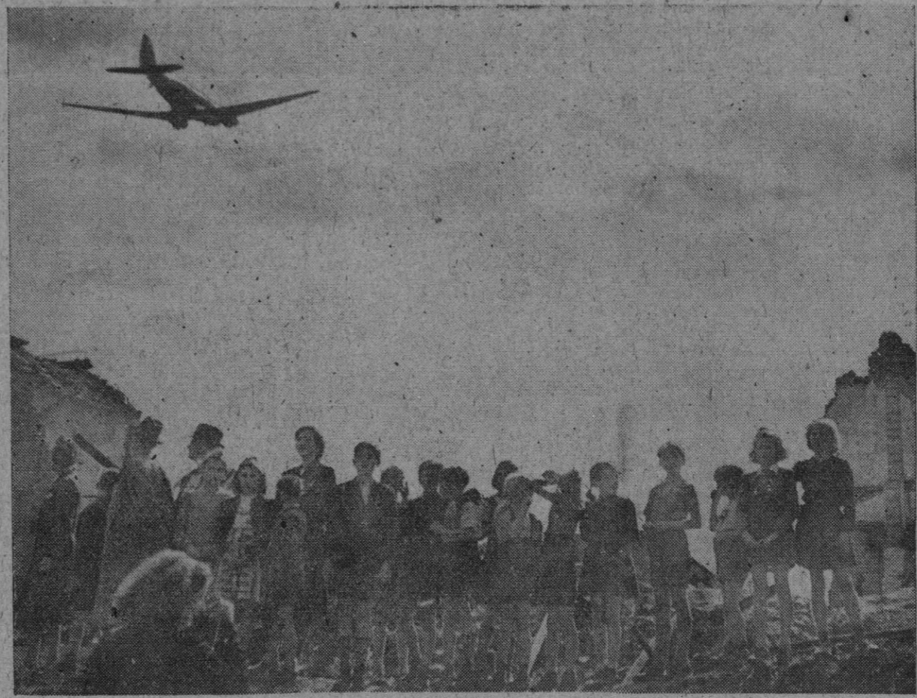
El bloqueo de las zonas occidentales de Berlín por los soviets agrava por momentos la situación alimenticia de la población. Los aliados de Occidente realizan los mayores esfuerzos para abastecer por vía aérea a los berlineses. El vuelo de los aviones encargados del abastecimiento es seguido por los habitantes de la capital alemana con dramática expectación. En la foto vemos un nutrido grupo de personas, niños en su mayoría, contemplando la llegada de los aviones, cuyo cargamento les servirá para seguir viviendo, pese a los diabólicos desiguos de la Unión Soviética, frecuentemente denunciados por los Gobiernos de Londres y Washington