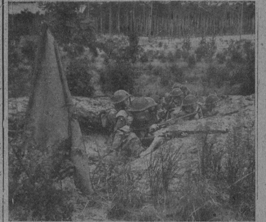
Conforme a los usos de la guerra, tropas inglesas pertenecientes al regimiento Real de Norfolk han construido trincheras en Spandau, situada a 150 metros de la frontera soviética en Alemania

Se cree que el primero trató en Berlín de reforzar las fuerzas inglesas en Alemania