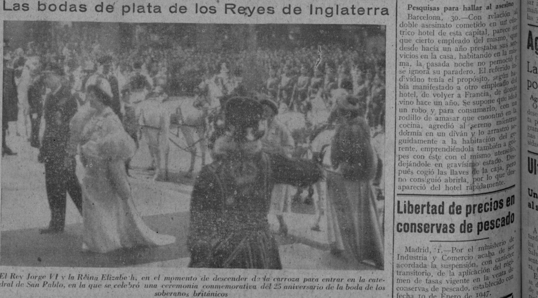
El Rey Jorge VI y la Reina Elizabeth, en el momento de descender de la carroza para entrar en la catedral de San Pablo, en la que se celebró una ceremonia conmemorativa del 25 aniversario de la boda de los soberanos británicos

La Habana, 30.—El dirigente comunista costarricense Manuel Mora ha sido detenido por soldados del Ejército cubano a su llegada a primera hora de hoy, procedente de Panamá.