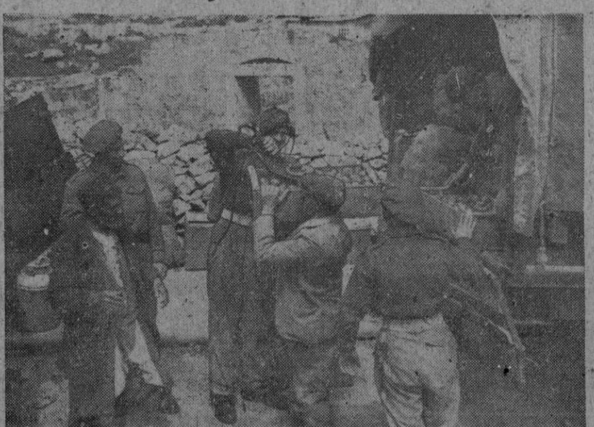
Ultimamente los árabes aislaron Jerusalén del resto de Palestina. A fin de que los judíos no careciesen de alimentos, soldados ingleses escoltaban coches con víveres para los hebreos. Al mismo tiempo dichas tropas efectuaban cacheos, y las armas encontradas eran cargadas en los coches que transportaban los víveres.

Tel Aviv, 26 (6 t.).—Los terroristas judíos del Irgun Zvai Lemmi han reanudado su ofensiva contra Jaffa, a pesar de las repetidas demandas del Haganah para que no ataquen esta ciudad árabe. La lucha comenzó hacia las once de la mañana.—Efe.