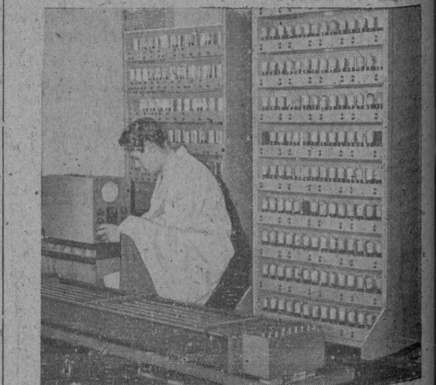
Máquina que sabe razonar y puede "recordar" todos los detalles largos cálculos que se le inculcan. Utiliza el "razonamiento" para recoger los mejores procedimientos probables para llegar a un resultado. La máquina no puede hacer nada hasta que un cerebro humano planteado el problema, logrado sus posibilidades y luego inculcadas "instrucciones". Es un espectacular método para ahorrar labor múltiple humana, pues la máquina puede hacer diez mil sumas de multiplicación en un minuto

SI QUIERE IMPRESOS PERFECTOS QUE DEN IDEA DE LA PROSPERIDAD DE SU NEGOCIO ENCARGUELOS EN LOS TALLERES DE EL ADELANTADO