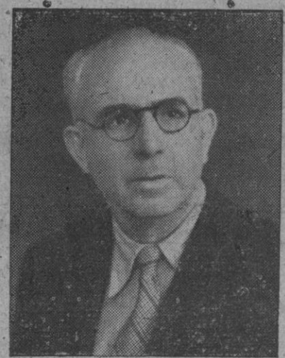
Doctor Paul Boffa, jefe del partido laborista de Malta y primer ministro de la isla