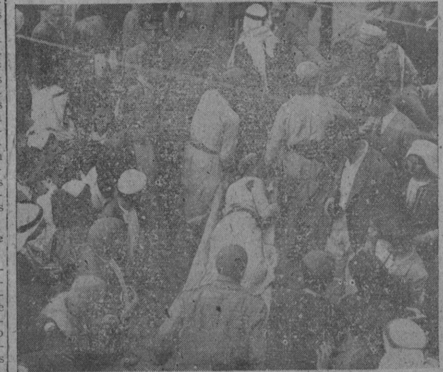
Una bomba lanzada por terroristas judíos contra un grupo de árabes en la puerta de Jaffa, causó quince muertos y cuarenta y un heridos. La fotografía recoge el momento subsiguiente a la explosión, en que son trasladadas algunas de las víctimas

Lake Success, 23 (1 t.).—Los delegados británicos en la O. N. U. han anunciado que en el curso de los acontecimientos ocurridos en Palestina desde el 30 del pasado mes de Noviembre al 10 del corriente, 2.000 personas han resultado muertas, de ellas 123, súbditos británicos, 1.065 árabes, 769 judíos y el resto de diversas nacionalidades.—Efe.