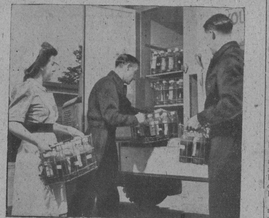
La transfusión de sangre, servicio organizado durante la última guerra mundial, ha quedado como labor permanente en la obra de la paz. La fotografía nos muestra un equipo de transfusión dedicado a la tarea de depositar en los refrigeradores la sangre de los voluntarios donantes