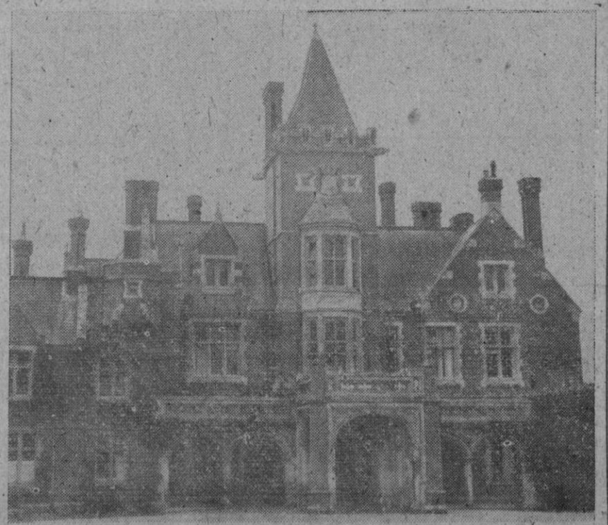
El nuevo palacio destinado para residencia de la princesa Isabel de Inglaterra y el teniente Felipe Mountbatten, cuando en el mes de Octubre contraigan matrimonio, y que sustituirá al que recientemente se incendió, se titula Boshor Park, habiendo pertenecido al duque de Connaught, tío de la ex Reina de España doña Victoria Eugenia. Esa futura morada de la heredera del trono británico y del teniente Felipe Mountbatten es, como puede verse en la fotografía, un lindo castillo que responde a la típica arquitectura inglesa