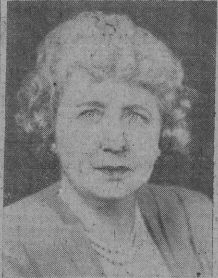
Mrs. Bess Truman esposa del Presidente de los Estados Unidos y, por tanto, la primera dama de la Unión norteamericana