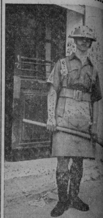
Soldado británico montando la guardia en un punto de Jerusalén

El general en jefe traslada a una villa fuertemente defendida