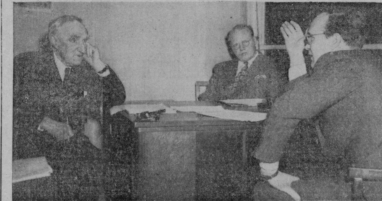
Sir John Boyd Orr (a la izquierda) aparece conversando con dos oficiales de la U. N. R. R. A. acerca de la grave situación alimenticia en Checoeslovaquia. El ha expresado "la ferviente esperanza" de que será posible transportar el trigo necesario para remediar la situación del pueblo checoeslovaco que él describe como sumido en la miseria.

Ayer mismo la Prensa soviética "predice" un mal año 1947 para los "países capitalistas". ¿Acaso es Checoeslovaquia un "Estado capitalista"? Todos sabemos que es uno de los países ocupados por la Unión Soviética, y que en él la devaluación que prevé en las naciones no sometidas a Moscú es, como en Hungría, Austria, etc. etc., una triste realidad actual.