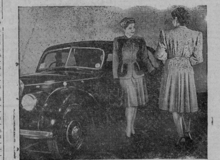
Una casa inglesa de modas tiene planeado un intercambio de modelos entre los Estados Unidos y la Gran Bretaña, para dar a conocer los últimos avances de la moda inglesa. Los modelos seleccionados para marchar a aquel país, fueron fotografiados en la sala de exposición de los coches Riley, en donde se exponían los últimos modelos de 1946 que consumen un litro y medio

Respecto a las fuerzas armadas, el plan establece que el Ejército y la Marina sean reducidas cuantitativamente, pero no cualitativamente y que queden completamente al margen de la política. Construcción de aviones de tipo comercial con establecimiento de líneas a Santiago de Chile, Washington, París, Madrid y Roma.