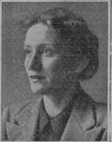
Edda Mussolini, viuda del conde Ciano, que ha sido puesta en libertad en virtud de la amnistía decretada por el Gobierno De Gasperi