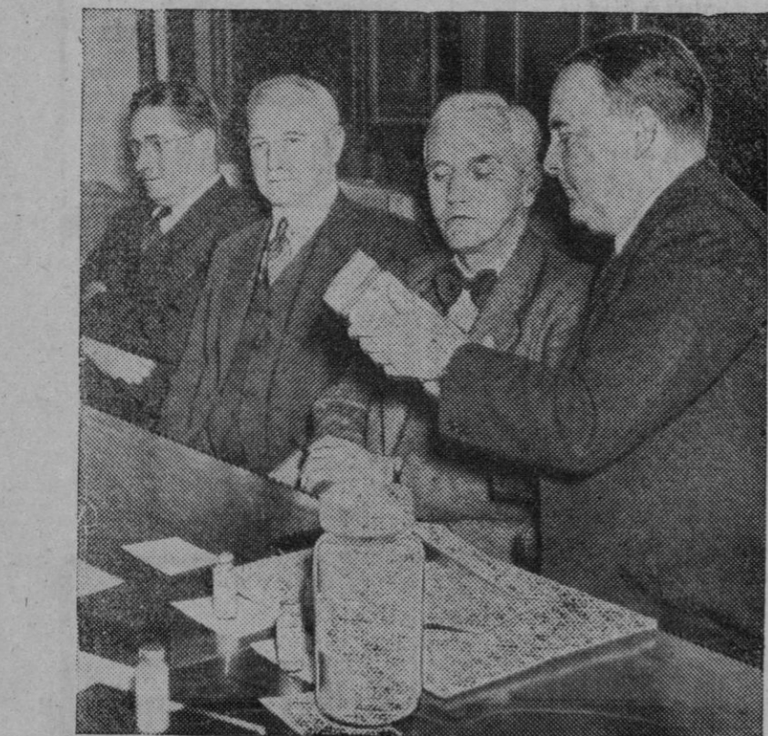
Como ya hemos indicado, en Inglaterra se produce penicilina en grandes cantidades. En la fotografía vemos al ministro de Abastecimientos, Mr. John Wilmot (derecha), examinando un tarro que contiene aquella maravillosa droga, durante una conferencia celebrada en Londres, con la asistencia del descubridor de la penicilina, profesor sir Alexander Flemings (al lado del ministro)