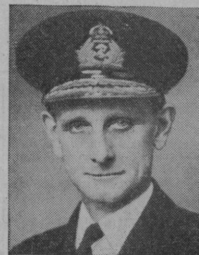
Almirante sir Algernon V. Willis, comandante en jefe de la flota británica en el Mediterráneo, que ha sustituido al almirante Cunningham. Fue durante dos años segundo lord del Almirantazgo