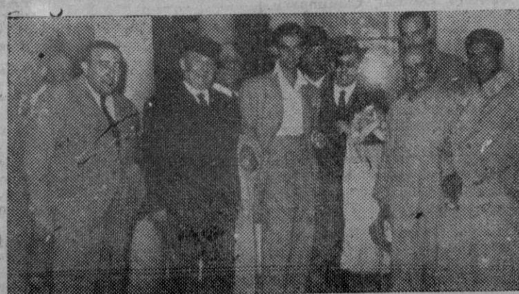
El famoso diestro "Manolete", a su llegada al aeródromo de Lisboa procedente de América, con sus compañeros de viaje y algunos amigos que acudieron a recibirle al campo de aterrizaje

CRECIENTE ENTUSIASMO ENTRE LOS ESPAÑOLES DE BUENOS AIRES ANTE LA LLEGADA DEL "GALICIA" Se organizan agasajos en honor de los marinos