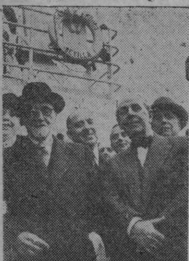
El ilustre dramaturgo español, don Jacinto Benavente, es recibido en el puerto de Barcelona por una comisión de la Sociedad de Autores de España y diversas personalidades