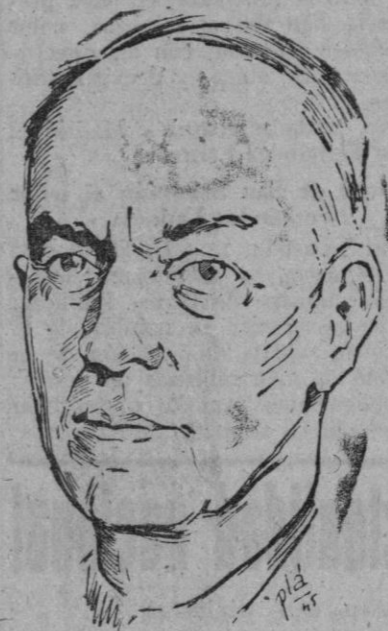
El mariscal Antonescu

Estambul, 13 (7 t).—Pena de muerte ha sido pedida para el mariscal Antonescu por el fiscal que entiende en el proceso contra el antiguo jefe del Estado rumano, según comunica de Bucarest, la Agencia Reuter.—Efe.