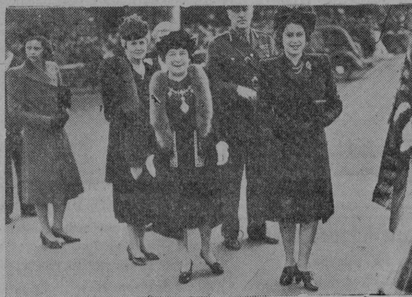
La Princesa Isabel de Inglaterra, que realiza una vida de constante contacto con su pueblo, ha visitado recientemente en compañía del lord Mayor la ciudad de Nottingham, donde fué objeto de un cariñoso recibimiento. Acaso la Princesa Isabel sea una de las más populares de la Casa Real británica. Vemos aquí a la Princesa luciendo un elegante modelo de sombrero que embellece la figura juvenil de la heredera del Trono británico

Si quiere IMPRESOS que den idea de la prosperidad de su negocio encárguelos a los talleres de