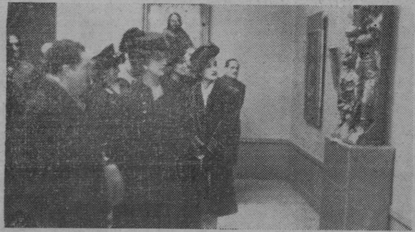
En el Palacio de Exposiciones del Retiro se celebra la Exposición Nacional de Arte Religioso. La esposa del Caudillo y su hija, acompañadas del director general de Bellas Artes, del presidente de la Exposición, de eminentes artistas y críticos de arte, han recorrido las distintas dependencias del Palacio, admirando las obras presentadas