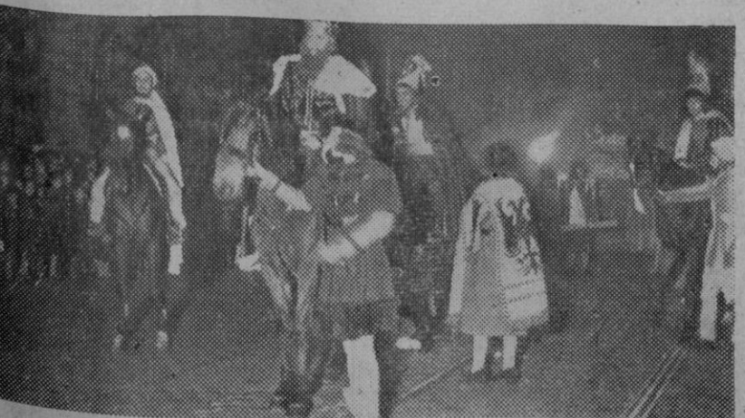
La cabalgata de los Reyes Magos organizada por la Jefatura provincial del Movimiento, de Madrid, desfila por las calles de la capital, entre la expectación de numerosos públicos