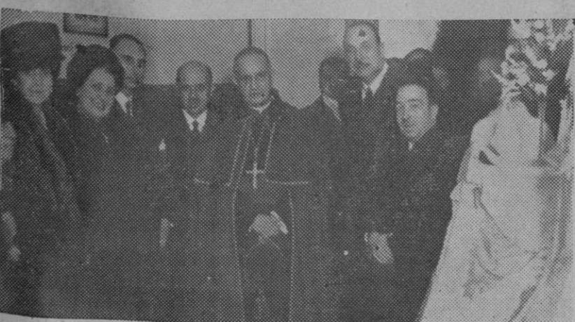
El obispo de Madrid-Alcalá, acompañado de altas personalidades civiles, clausuró la Exposición de Trabajo organizada por el Tribunal Tutelar de Menores