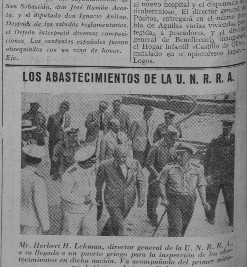
Mr. Herbert H. Lehman, director general de la U. N. R. R. A., a su llegada a un puerto griego para la inspección de los abastecimientos en dicha nación. Va acompañado del primer ministro helénico, el ministro de Agricultura y el ministro de Comercio.