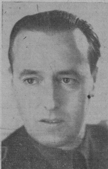
El delegado nacional de Sindicatos, camarada Sanz Orrio, que ayer pronunció un interesante discurso en el acto inaugural del Certamen