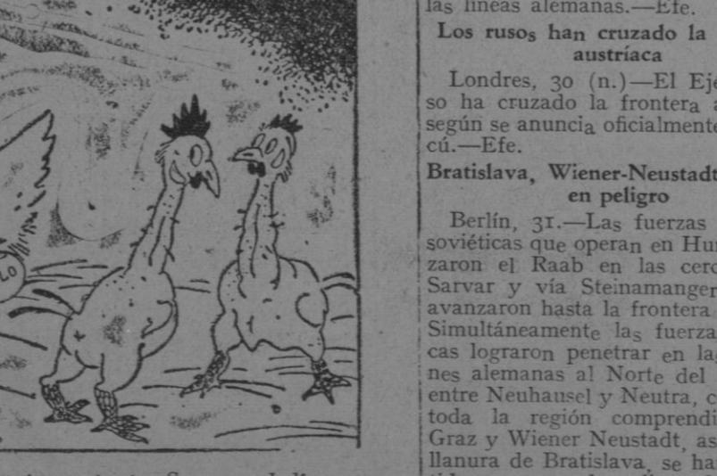
—Esta pobre gallina Papanatas es tonta. Se pasa el día empollando huevos ajenos y hueros.