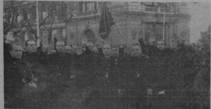
El camarada Arrese que, en representación del Caudillo, presidió como ministro secretario general del Movimiento el duelo en el entierro de las camaradas vílmente asesinadas por los comunistas. Acompañado del Gobierno en pleno, presencia el fervoroso y entusiasta desfile de la Falange y del pueblo madrileño