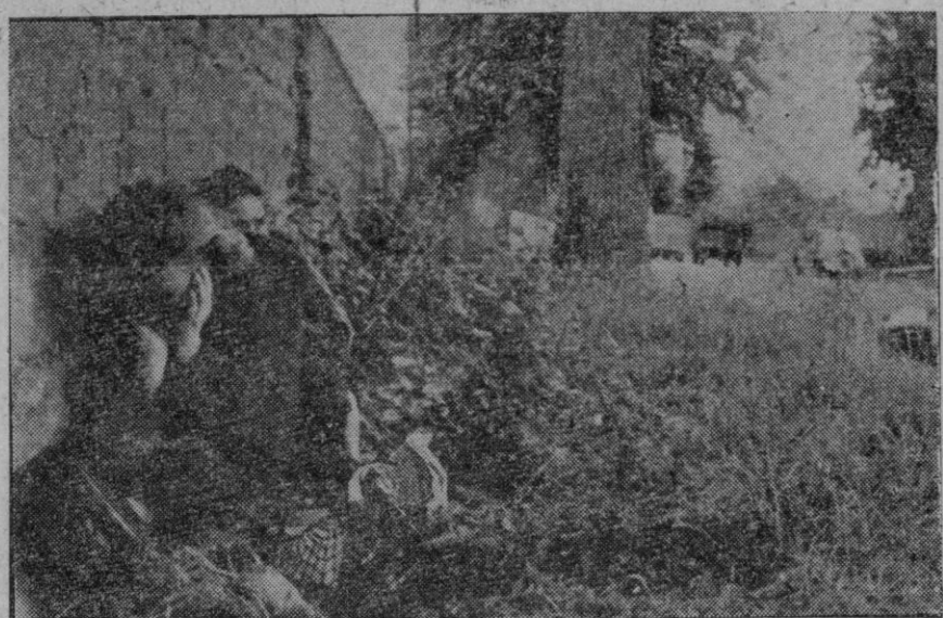
Dois mujeres francesas fugitivas de los horrores de la guerra por una carretera normanda, se ven obligadas a hacer un alto en la marcha para ampararse bajo un muro por la presencia de aviones aliados en vuelo bajo

Berlín, 12 (5 t).—La base aliada de Juvigny, en el sector occidental