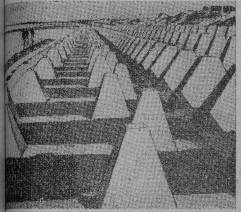
El campo de playa del Canal de la Mancha ofrece el aspecto de esta fotografía con sus obstáculos antitanques como defensa inicial de las fortificaciones costeras

... POR CUALQUIER PUNTO MENOS POR EL ATLANTICO