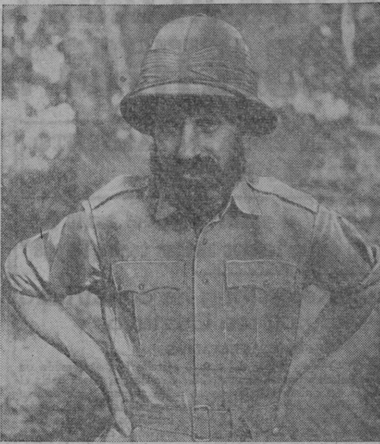
El general de división Orde Charles Wingate

Cójase la fe fanática de Oliverio Cromwell, la audaz iniciativa del coronel Lawrence, el ansia por las empresas desiguales de Robert Olive y, fundándose en el fuego del entusiasmo, el resultado obtenido será el general Orde Charles Wingate, el hombre que vivió durante tres meses detrás de las líneas japonesas, el jefe de los «Espíritus», el famoso general de brigada que hizo que hasta los oficiales veteranos del Ejército anglo-indio abandonasen su desdén por las tácticas heterodoxas y murmurasen su mejor frase de alabanza.