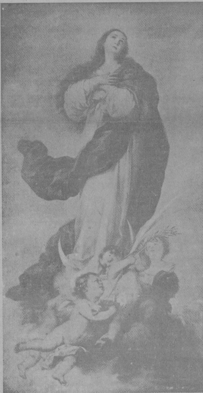
LA INMACULADA CONCEPCION PATRONA DE ESPAÑA

Esta manifestación ha sido una de las más importantes que han tenido lugar en la capital del Protectorado. Una gran multitud de elementos marroquíes recorrió varias