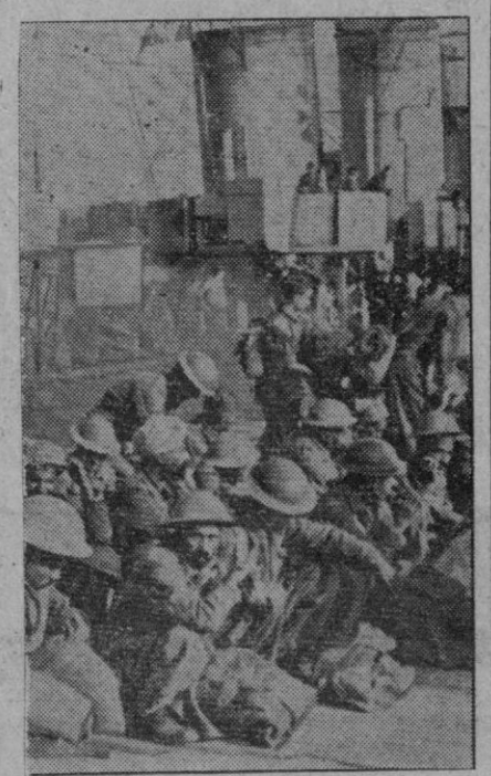
Soldados indios que luchaban al lado de los ingleses, hechos prisioneros por los alemanes al ocupar una isla del Egeo

puente han ocupado las aldeas de Continiera y Carocetta, en la carretera Anzio-Albano, y de Campo Morto y Borgo Montello. Carocetta está a unos cuarenta kilómetros al Suroeste de Roma. Por otra parte, los alemanes han desviado las aguas del Rápido, a cinco kilómetros al Norte de Cassino, provocando así la inundación de la carretera Cassino-San Elio. En el Galliano inferior, los británicos han avanzado kilómetro y medio al Norte de Suio. En la cabeza de puente del Sur de Roma han sido hechos 600