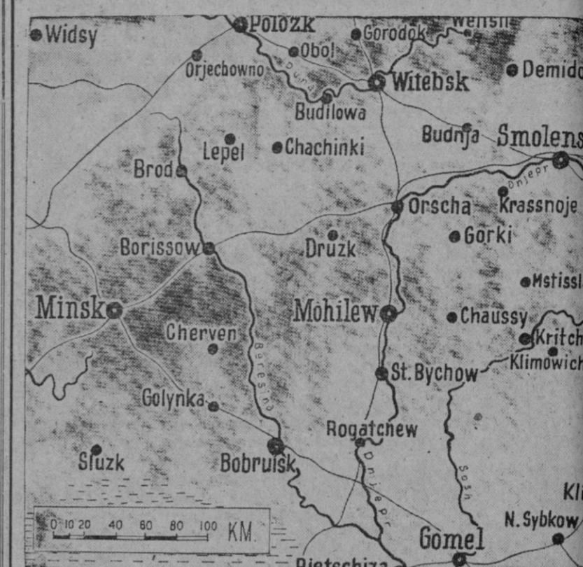
Gráfico del campo de batalla Witebsk-Gomel

En los demás sectores también se rechazan las fuerzas soviéticas