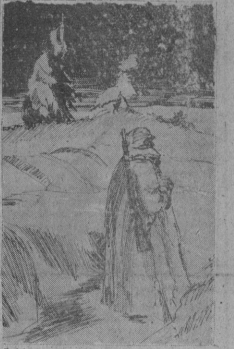
Soldado alemán de vigilancia en un puesto avanzado, según un dibujante corresponsal de guerra alemán