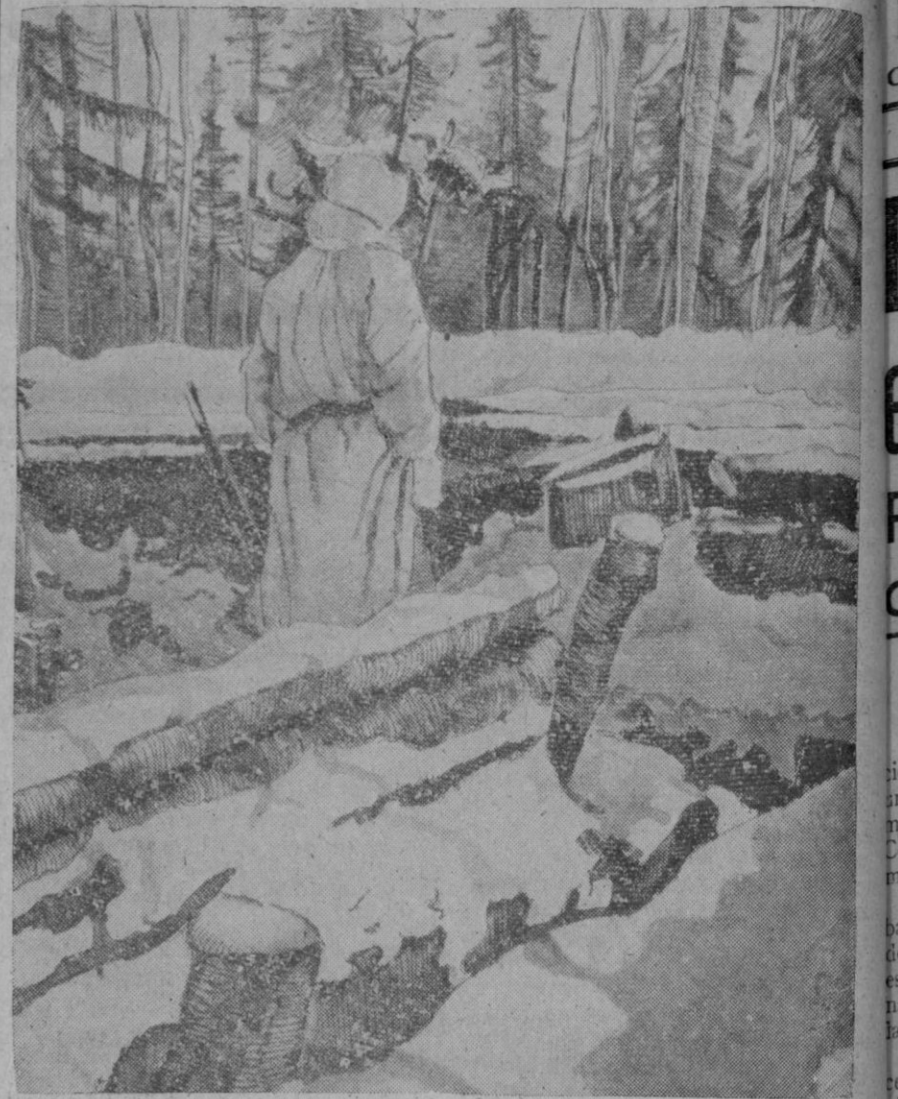
Puesto de vigilancia establecido por tropas alemanas en las selvas de la región septentrional del frente del Este