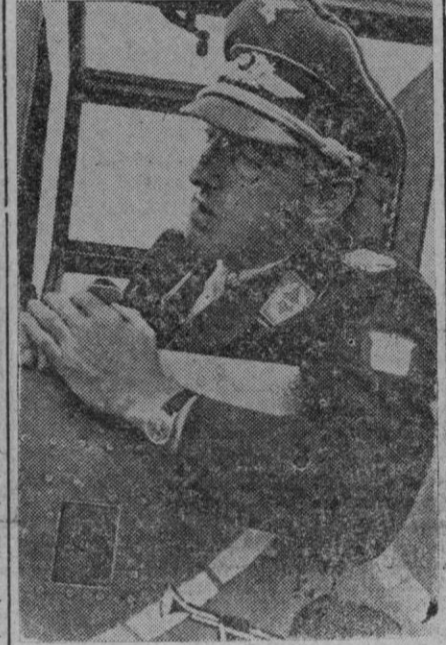
El comandante de la aviación alemana, Graf, condecorado recientemente por el Führer con el más alto distintivo alemán al valor

Durante las últimas horas de la tarde fueron atacadas por importantes fuerzas aéreas británicas las regiones de la confluencia del Rin y del Mein. Fueron arrojadas bombas explosivas e incendiarias que originaron graves daños en los barrios de vecindario, principalmente en Franc-