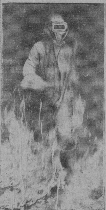
Cual un nuevo San Juan Hus, este bombero, equipado con un traje especial que le protege de las llamas, atraviesa un mar de fuego para prestar servicio de salvamento.

Se encuentra en Badajoz el delegado nacional de Prensa Hoy saldrá con dirección a Sevilla