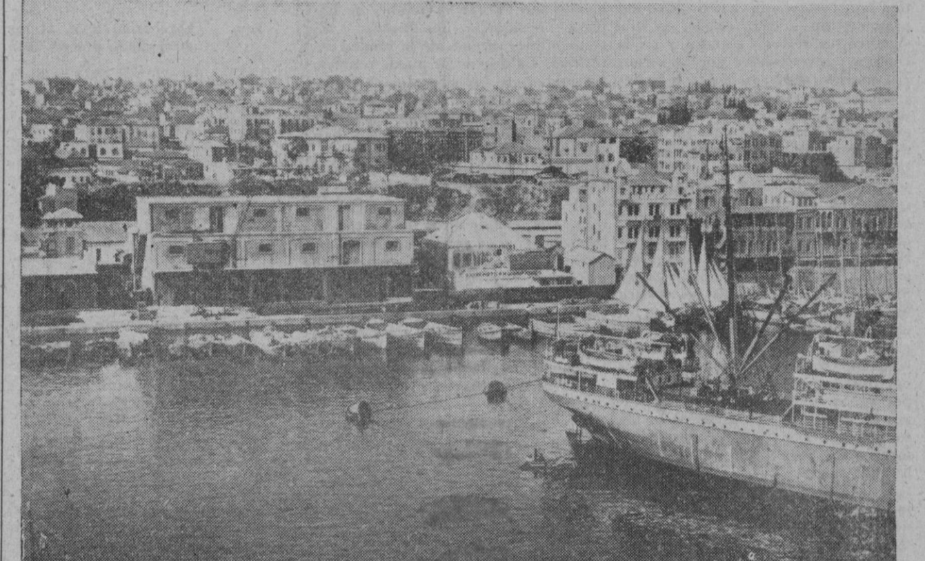
Una vista de la zona portuaria de la ciudad de Beirut, capital del Líbano, en la que se han desarrollado, y duran todavía, acontecimientos de carácter político que son causa de profunda preocupación en los medios oficiales de las potencias aliadas

La población ha ocupado varios ministerios