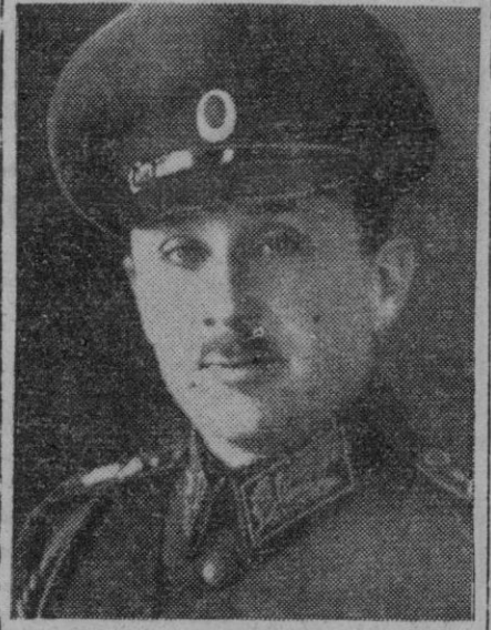
El Príncipe Cirilo de Bulgaria