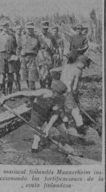
El mariscal finlandés Mannerheim inspeccionando las fortificaciones de la costa finlandesa.

Londres, 24 (5 t.).—El coronel Knox, secretario de Marina norteamericano, ha puesto de relieve, en unas declaraciones de importancia de que el público británico comprenda que la guerra en el Pacífico es tan importante como la guerra contra Alemania. «En los Estados Unidos—dijo—domina la idea de que la Gran Bretaña considera como una guerra real el conflicto europeo, y da una importancia secundaria a la configuración del Pacífico, y que una vez que Hitler haya sido derrotado se dejará a Estados Unidos seguir la guerra en el Pacífico como si se tratara de un asunto de su exclusiva incumbencia. Debería hacerse todo lo posible para borrar esta impresión, que prevalece en el espíritu del norteamericano. Continuó Knox haciendo un análisis de la guerra en el Pacífico y poniendo de relieve la importancia de las batallas que allí se libran». La Gran Bretaña—declaró—tiene su guerra submarina en el Atlántico, y los Estados Unidos libran la suya en el Pacífico. Una tercera parte de las fuerzas navales niponas, incluidos los barcos incorporados a la Marina japonesa después de la acción de Pearl Harbour, ha sido hundida. Refiriéndose a la U. R. S. S., Knox dijo que en el mundo de la post guerra, la U. R. S. S. desempeñará un papel muy importante, y que Estados Unidos desea su colaboración con todos sus recursos.—Efe.