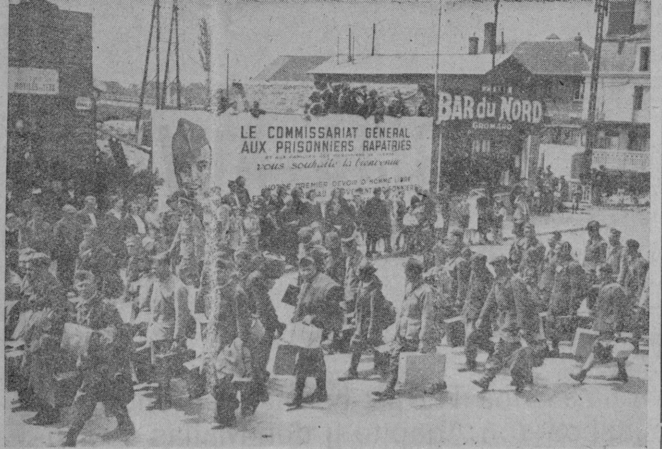
Frecuentemente llegan a Francia prisioneros franceses repatriados de Alemania al ser canjeados por obreros de la misma nacionalidad. Nuestra foto muestra el momento de la recepción de un contingente de repatriados en la estación de Compiègne

El desgaste inherente a todo conflicto bélico no ha podido ser reparado, a pesar de los esfuerzos de las obras del Estado y del Partido que entienden en esta misión constructora. El problema, pues, que ya comenzó con anterioridad al año 1936, se encuentra ahora en su período agudo. Ya hemos señalado que el Instituto Nacional de la Vivienda ha preparado un plan que, una vez aprobado por el Caudillo, será llevado a cabo con toda rapidez. Pero es necesario para encontrar la solución total del problema la colaboración de todos los españoles. Nos complace recoger aquí el hecho laudable del Monte de Piedad de Segovia que, ante la actual campaña de la Prensa nacional, ha acordado la construcción en nuestra ciudad de una colonia de viviendas protegidas. A éstas hay que añadir las que tienen en proyecto la Obra Sindical del Hogar y el excelentísimo Ayuntamiento. Es necesario que todos los españoles que puedan, sigan estos ejemplos. El capital privado debe cumplir su misión en esta tarea de construir. Porque en definitiva es urgente construir para que los núcleos de población puedan responder debidamente al aumento de sus habitantes. En sucesivos artículos iremos señalando nuevos aspectos del problema que marcarán bien a las claras la naturaleza de este problema y la urgencia que debe ponerse en resolverlo.