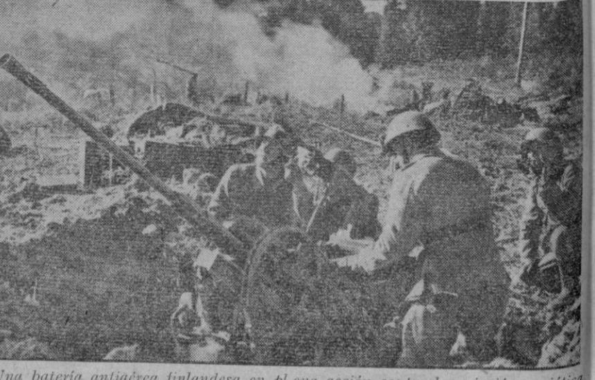
Una batería antiaérea finlandesa en plena acción contra la aviación soviética

LIBROS, TRABAJOS COMERCIALES E IMPRESOS DE LARGA TIRADA ENCARGUELOS EN EL ADELANTADO