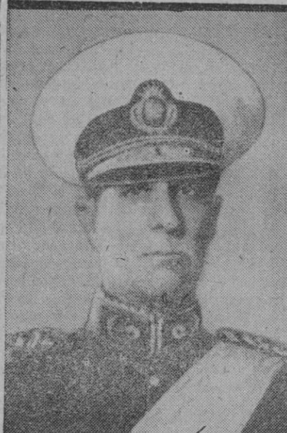
El general don Pedro Ramirez, nuevo Presidente de la Argentina, después del golpe de Estado encabezado por el general Rawson

En un carta dirigida por el general Ramirez, nuevo Presidente de la Argentina, a monseñor Franceschi, obispo de Buenos Aires, figura el siguiente bello párrafo: