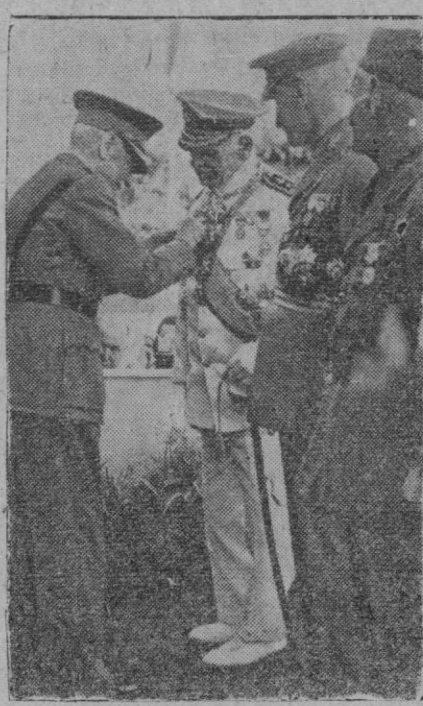
Con asistencia del general Carmona, jefe del Estado, y en la plaza del Imperio, en Lisboa, se ha celebrado este aniversario, recordando a los héroes de Africa. El general Carmona condecora a combatientes que se distinguieron en Africa y con ello simboliza la condecoración de todos los héroes que se distinguieron en aquella campaña