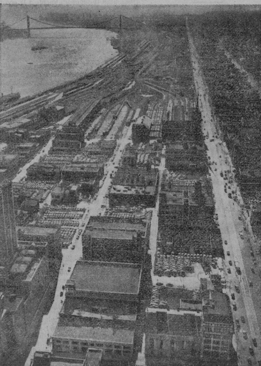
Una vista general del gran distrito industrial de Detroit (del Estado de Michigan, Norteamérica), en donde recientemente se registraron desórdenes de carácter racial, alcanzando tal gravedad, que fue declarado allí el estado de excepción

1.600 huelguistas en una fábrica de material de guerra de Detroit