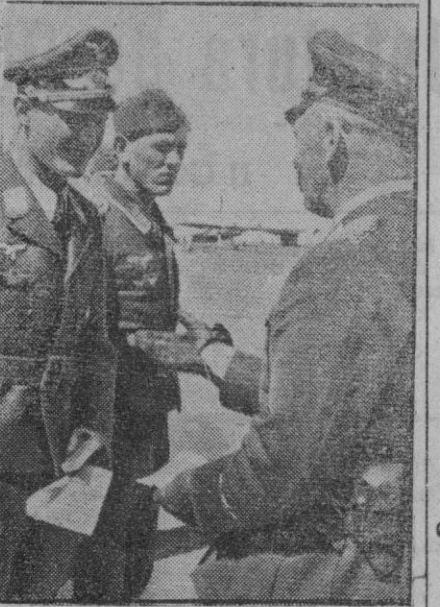
El mariscal alemán von Richthofen, poseedor de las hojas de roble, en su visita a la cabeza de puente del Kubán. Aquí le vemos saludando a un grupo de pilotos de dicho sector