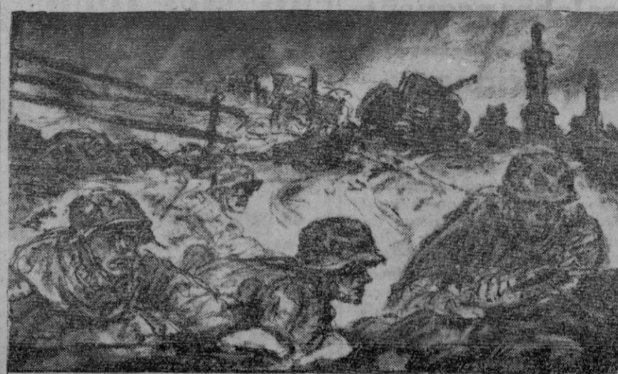
El líder del correspondiente de guerra alemán, ha trazado la realidad de una lucha en que los soldados alemanes defienden una ciudad anteriormente conquistada.