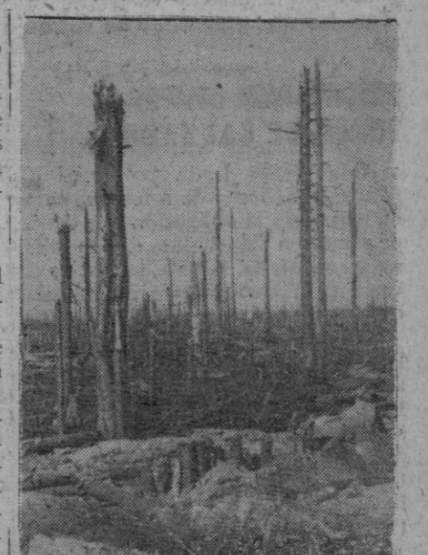
He aquí el aspecto de un campo en el sector de Laloga, el cual se encuentra en deplorable estado, después de los duros combates desarrollados en él.

También ayer, Pantelaria fue el objetivo de incursiones reiteradas, en el curso de las cuales siete aviones enemigos fueron derribados por los cazas y las baterías de la D. C. A. En combate con los cazas alemanes, el