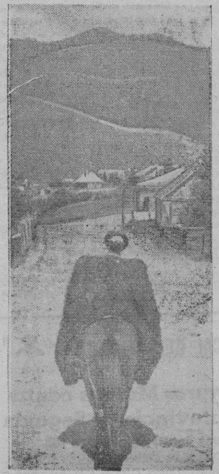
PANORAMAS DEL CAUCASO.—Una aldea caucásica en las estribaciones del monte Elbrus

Una vez más la Falange cala hondo en la entraña nacional, ya proclamada en la hermandad auténtica de la Ciudad y el Campo. Frente al viejo tópico liberal que concede derechos de "ciudadanía" y establece con ello una aristocracia rampiña ganada por la permanencia en los cafés y en las calles; frente al engaño marxista que proclama su desprecio en el manifiesto comunista hacia los que trabajan la tierra y son esperanza eterna de España, el