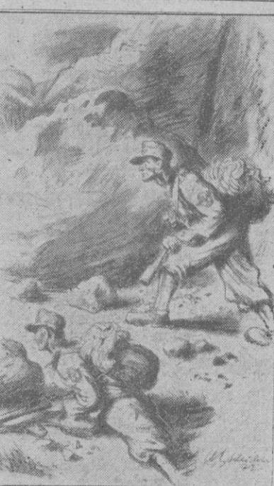
Cazadores de montaña alemanes...