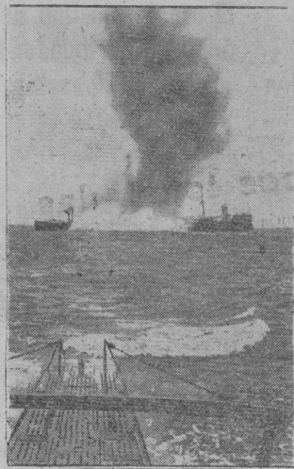
Continuamente se hallan los submarinos alemanes a la casa de barcos enemigos. La foto muestra al submarino alemán del capitán de corbeta Topp, momentos después de haber hecho blanco con sus torpedos en un barco de once mil toneladas

Bangkok, 14 (2 t.).—Nuevas informaciones sobre el ciclón desencadenado en Bengala, dicen que once mil personas han perecido en la catástrofe. Además, el ciclón destruyó seiscientos mil casas. Han sido afectadas por la catástrofe, millón y medio de personas.—Efe.