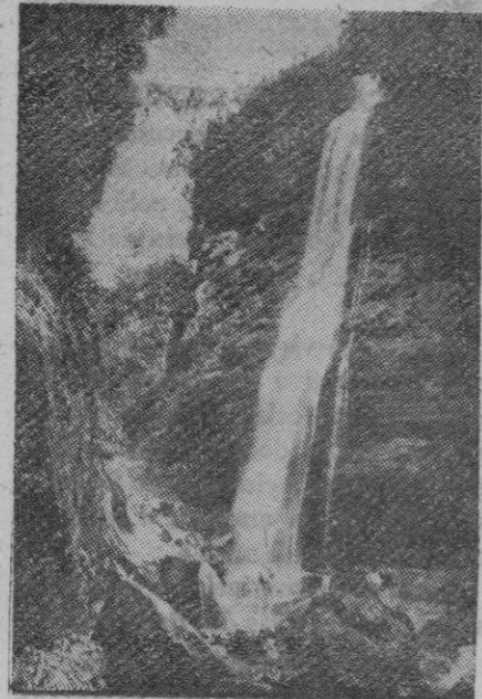
La isla de Luzón, en las Filipinas, está cubierta de bosques y de montañas de gran belleza por su vegetación exuberante. En el grabado vemos la cascada de Fidelisan.

Shanghai, 7 (5 t.).—Las informaciones de origen chino según las cuales los soldados de Chung-King habían entrado en Shanghai, han sorprendido grandemente a la población. La ciudad y sus alrededores se hallan en completa calma. Se declara por otra parte, que las operaciones anunciadas por la radio de Nueva Delhi son absolutamente imposibles, ya que entre Shanghai y Nankin sólo se registra la presencia de pequeñas partidas de chinos que únicamente llevan a cabo algunos golpes de mano aislados. Las líneas ferroviarias se hallan fuertemente protegidas, y la circulación de los trenes está asegurada. En Nankin también reina una tranquilidad perfecta.—Efe.