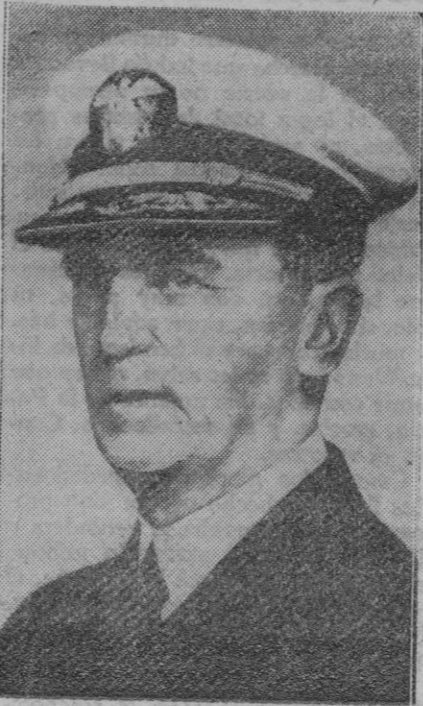
Almirante William D. Leahy, embajador norteamericano en Vichy, que ayer entregó en Vichy la nota del Gobierno de su país aprobando el desembarco inglés en Madagascar

Comunicado alemán Berlín, 7 (6 t.).—El comunicado de hoy, contra los objetivos militares de Africa del Norte, fué realizado sobre las concentraciones de tropas y camiones que se descubrieron cerca de la frontera Oeste de Egipto. Simultáneamente se bombardeó por los aviones alemanes las instalaciones ferroviarias del nudo de comunicaciones de dicha zona, los refuerzos ingleses y las concentraciones de camiones del Este de Marmárica, operaciones que fueron coronadas por el éxito. Sufrieron especialmente los efectos de las bombas alemanas los aviones que se encontraban en un aeródromo de campaña británica, al Este de Sollum, y una concentración de automóviles descubierta un poco más lejos. Se supone que gran número de camiones y de auto-ametralladoras, resultaron con daños.—Efe.