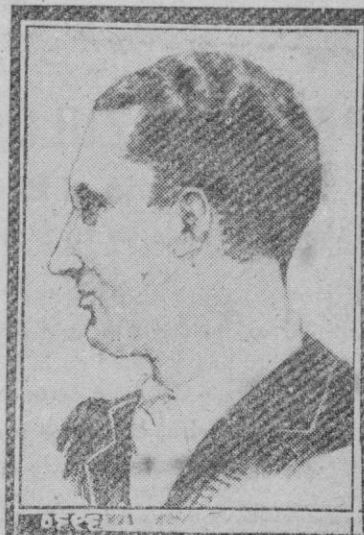
BARRASSINA, el árbitro italiano del partido Alemania-España jugado el domingo en Berlín

Estocolmo, 14 (2 t.).—Radio Bostón anuncia que los británicos en Birmania se han visto obligados a retirarse a nuevas posiciones.