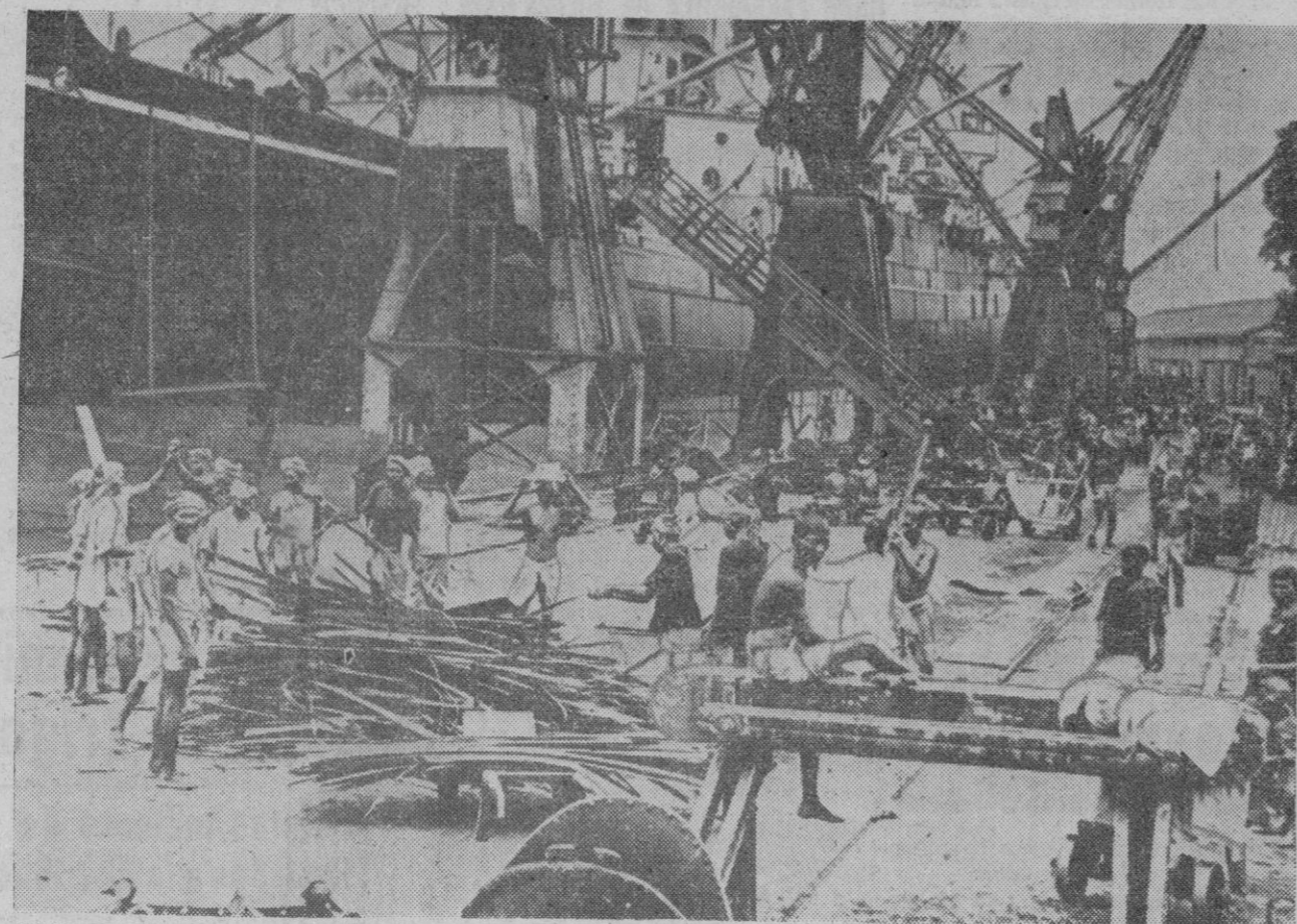
LOS PREPARATIVOS DE GUERRA EN LA INDIA.—Obreros nativos descargando chatarra de un vapor, en el puerto de Calcuta, para ser transformada por las industrias de guerra en material bélico

Ciertas consideraciones políticas han apresurado el ataque japonés en dirección a la INDIA