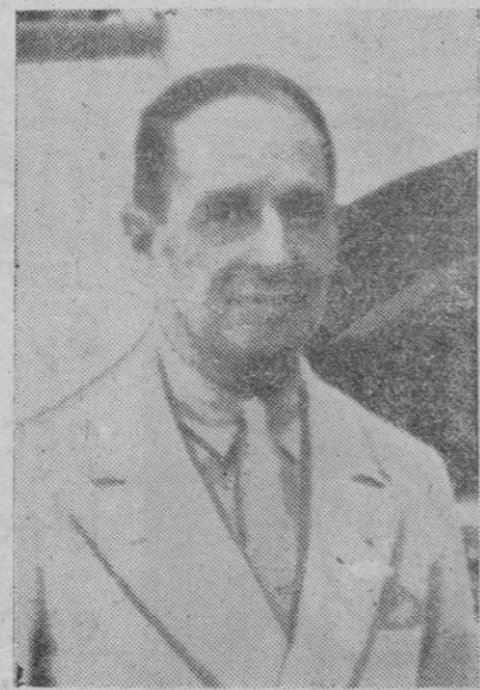
GENERAL MAC ARTHUR, que fué el jefe de las fuerzas norteamericanas en Filipinas y llegó recientemente a Australia para ocupar el puesto de comandante en jefe de las fuerzas aliadas en el espacio del Pacífico.