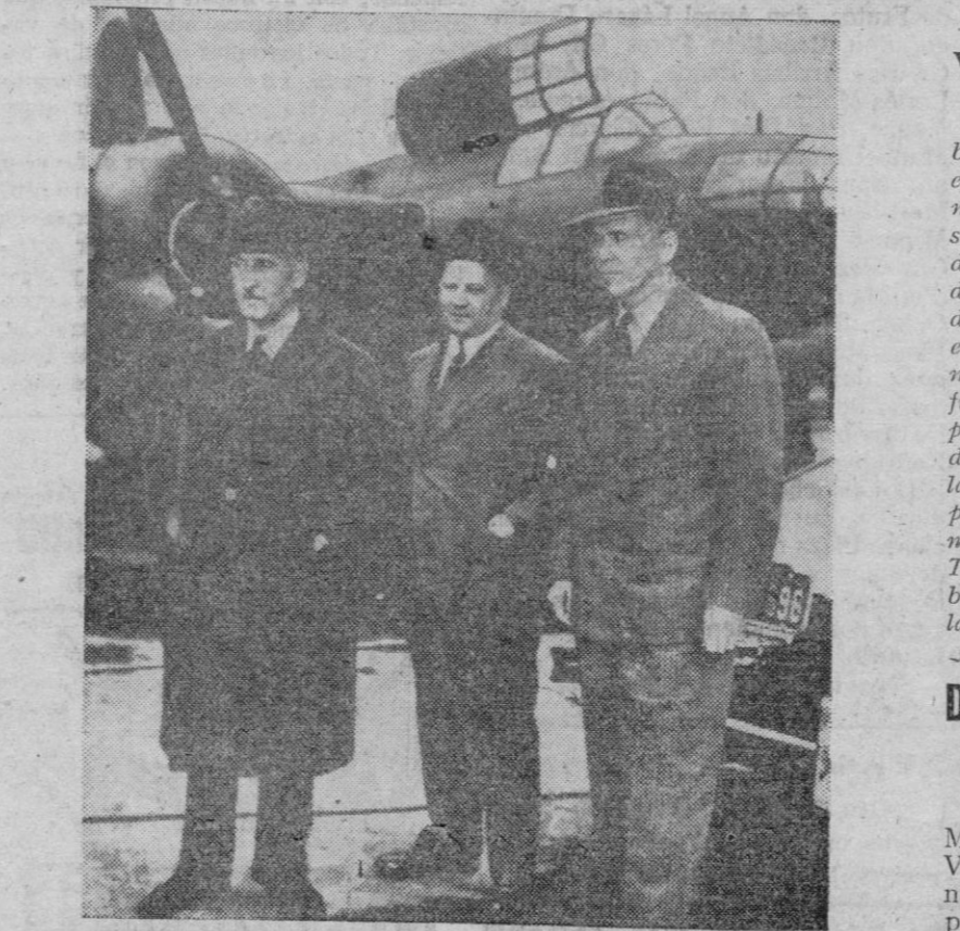
Las llamadas "fortalezas volantes" se construyen en las fábricas Boeing, fundadas por el americano Bill-Boeing y el sueco Filipo-Gustavo Johnson. A éste le vemos en la fotografía entre el ministro de la Guerra, Stimson (a la izquierda) y el general Marshall (a la derecha)