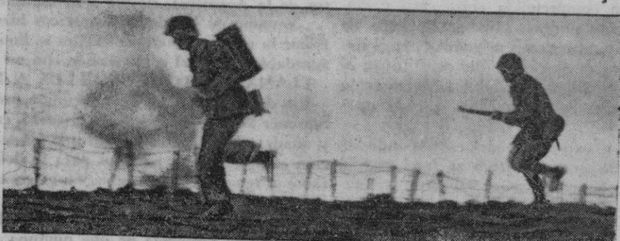
Infantes alemanes en un contraataque a las fuerzas inglesas en un sector de Libia, donde a pesar de la superioridad numérica del enemigo venden caro las pequeñas cesiones de terreno

Continúan los combates. Intensa actividad de la aviación del Eje