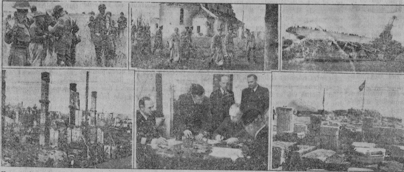
En esta foto vemos reproducidos los hechos de guerra más importantes del año 1941: de izquierda a derecha tenemos, captura de soldados británicos en Creta por paracaidistas alemanes; visita del Führer y el Duce al frente Este; portaviones "Ark Royal" hundido por un submarino alemán (superior); ruinas de Smolensko; firma de un acuerdo sobre la dirección de la guerra entre Alemania, Italia y Japón; la bandera alemana sobre la Acrópolis de Atenas (inferior)

Bucarest, 16 (2 t.).—El mariscal Antonescu ha dirigido al Ejército rumano la siguiente orden del día: Las formaciones de caballería y artillería han renovado las glorias del Ejército rumano en el curso de los combates del Dnieper y del mar de Azov. Desde el 27 de Septiembre al 30 de Octubre de 1941, estas unidades han resistido al enemigo, rechazando y contraatacando a fuerzas numéricamente superiores que, finalmente, fueron aniquiladas cerca de Obittohnaya.