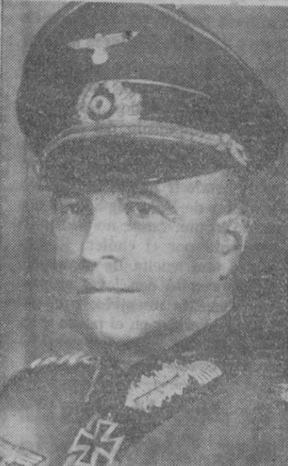
El mariscal von Brauchitsch, comandante en jefe del Ejército alemán desde Febrero de 1939 al 19 de Diciembre del pasado año, fecha en que tomó el mando supremo del Canciller Adolfo Hitler

En Africa del Norte el enemigo ha continuado cañoneando con sus fuerzas navales y terrestres las bases germano-italianas del sector de Sollum. En la parte occidental de Cirenaica, ninguna operación importante. Los bombarderos y stukas alemanes atacaron a las columnas enemigas en marcha y los aeródromos de Cirenaica, así como los campamentos cercanos a Marsa-Matruh. Prosiguieron con éxito los ataques aéreos, durante el día y la noche, contra los aeródromos y las fortificaciones militares de la isla de Malta. Los aviones alemanes de transporte han derribado el 13 del corriente mes, sobre el Mediterráneo, dos aviones ingleses de destrucción, que intentaron atacarles. Los aparatos británicos bombardearon en la pasada noche Emden y otras localidades del litoral Norte de Alemania. Se registraron muertos y heridos entre la población civil. Tres bombarderos británicos fueron derribados.—Efe.