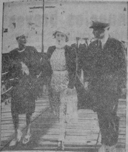
Duff Cooper paseando con su esposa en Singapur, del mando de cuya plaza ha sido destituido

A 150 millas de la estatua de la "Libertad" ha sido torpedeado y hundido un gran petrolero