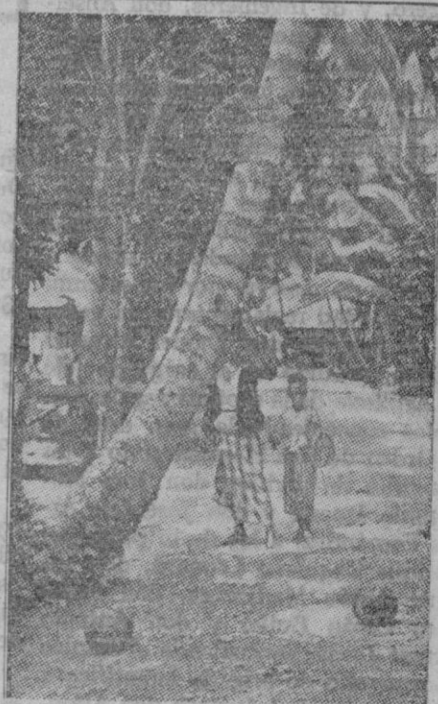
En la isla de Sumatra, monjes amestrados colaboran en la recolección de cocos. El simio, atado a una larga cuerda, trepa al cocotero, y siguiendo las instrucciones del hombre, comienza a arrojar los cocos al suelo