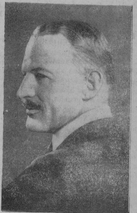
Sir Robert Brooke Pophan, defensor de Singapur

Washington, 5 (2 t.).—Todas las fuerzas navales y terrestres que se encontraban en Manila, fueron evacuadas antes de la entrada de los japoneses en la capital filipina, ha declarado el portavoz militar del departamento de Guerra. Desmintió además las informaciones de origen japonés, según las cuales los destacamentos nipones entrados en Cavite habían tomado posesión de 17 destructores norteamericanos, 25 submarinos y un portaaviones de la misma nacionalidad que se encontraban en dicho puerto, y aclaró que ningún buque de la flota de guerra norteamericana se encontraba en la base naval de Cavite al ser ocupada por el Ejército imperial.—Efe.