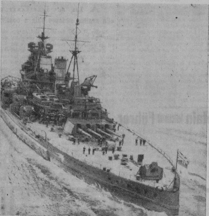
El acorazado inglés «Prince of Wales», hundido en aguas del mar de China por los japoneses al iniciarse la guerra en el Pacífico

Nueva York, 2.—La Gran Bretaña ha renunciado a establecer un frente británico en Rusia—anuncia radio Nueva York—. La decisión ha sido adoptada por la necesidad de concentrarse en cualquier momento en posesión del mayor número posible de hombres disponibles que puedan ser enviados a los diversos frentes de guerra. Parece que los primeros contingentes serán enviados a Extremo Oriente, singularmente a defender Singapur.—Efe.