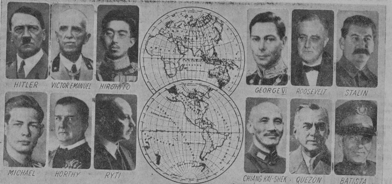
He aquí los jefes de los Estados más importantes de la segunda guerra mundial. De izquierda a derecha: El Canciller alemán, Adolfo Hitler; Victor Manuel III, Rey-Emperador de Italia; Hiro-Hito, Emperador del Japón; Jorge VI, Rey de Inglaterra; Roosevelt, Presidente de los Estados Unidos; Stalin, dictador de la Unión Soviética; el Rey Miguel de Rumania; Arsmaveit Horthy, Regente de Hungría; Rytí, Presidente de Finlandia; Chang-Kai-Chek, jefe de la China de Chung-King; Quezon, Presidente de Filipinas, y Batista, Presidente de Cuba