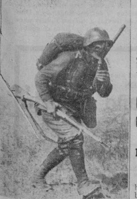
Como acaba de demostrarlo, el Japon posee un Ejército moderno y bien equipado. El soldado nipón es pequeño de talla, pero son proverbiales su coraje, su tenacidad y su espíritu de sacrificio. En la ilustración vemos a un soldado nipón de infantería con su equipo de combate completo, sin que le falte la máscara antigases.