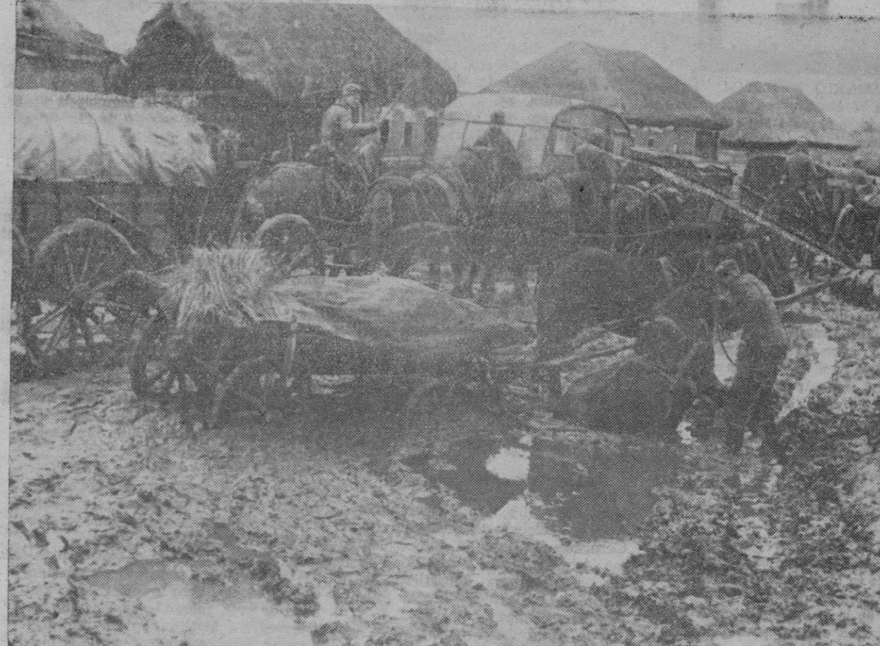
FRENTE DEL ESTE.—En estas condiciones suelen circular por tierras soviéticas los convoyes de abastecimiento de las fuerzas europeas

No se han registrado combates de importancia en AFRICA del NORTE