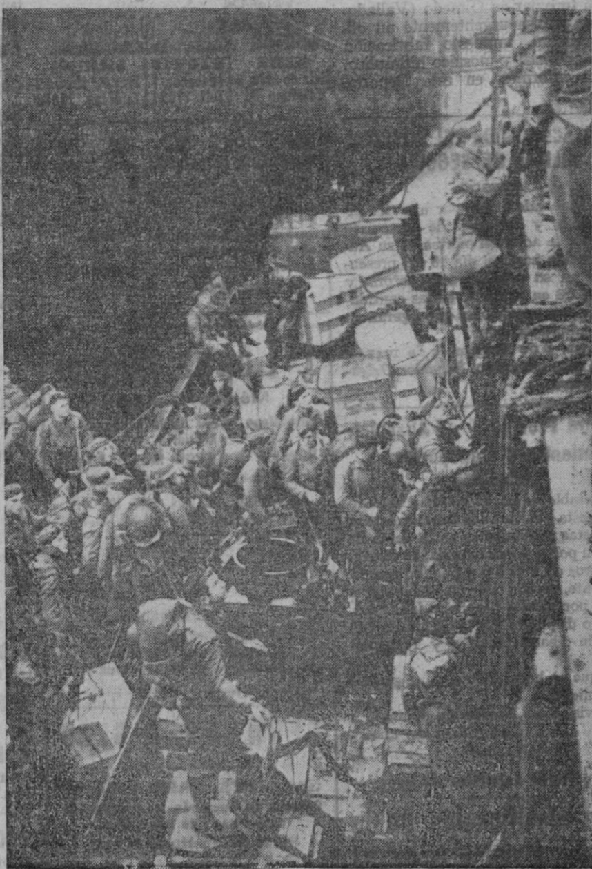
Un destacamento de Infantería norteamericana desembarcando, con su material, en un punto de Islandia

Comunicado alemán Cuartel General del Führer, El alto mando de las fuerzas alemanas comunica: El curso de las operaciones que se desarrollan ante los lagos Ilmen y en dirección a Wolchof, fortificaciones de infantería y carros blindados ocuparon por sorpresa la noche del 9 de Noviembre el importante centro de comunicaciones de Numerosos prisioneros han sido capturados y recogido un importante botín. El Estado Mayor del Ejército soviético logró escapar abandonando sus automóviles e importantes documentos militares. En el frente, han sido capturados prisioneros desde el 16 de agosto, así como noventa y seis cañones y ciento setenta y nueve torpedos, un tren blindado y abundante material de guerra de toda clase. Unas seis mil minas han sido capturadas. La cifra total de prisioneros soviéticos capturados en el frente del Este, se eleva actualmente a tres millones seiscientos treinta y tres mil hombres.—Efe.