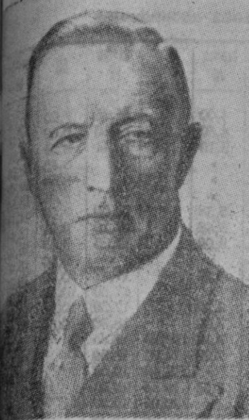
General Von Stulpnagel, comandante de las fuerzas alemanas de ocupación, en Francia