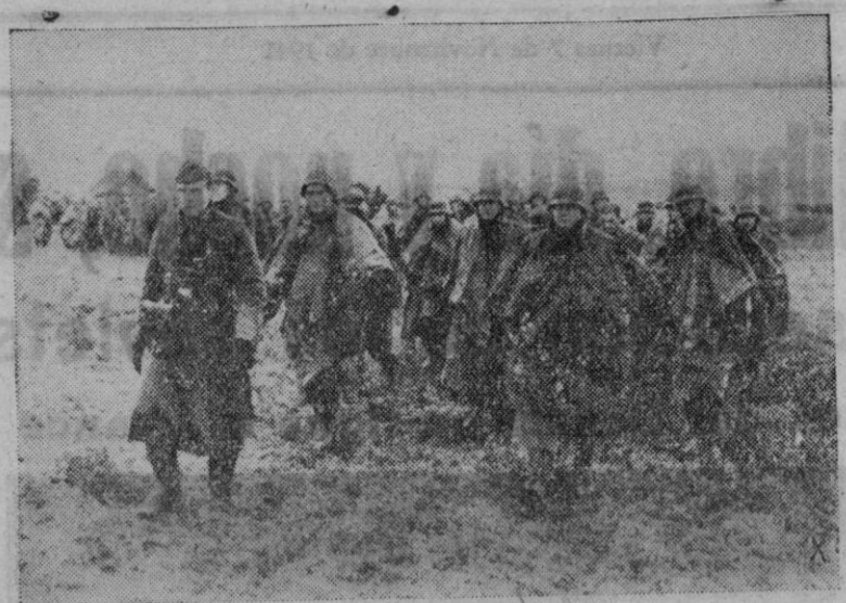
EL AVANCE ALEMÁN EN EL ESTE.—El tiempo fue muy desfavorable y duro durante los últimos combates de decisión. Las arreteras inundadas hacían casi imposible el avance de las tropas. El espíritu combatiente de éstas fué extraordinario

Angora, 6.—La primera locomotora inglesa enviada por la Gran Bretaña a Turquía, en virtud de los acuerdos comerciales vigentes entre ambos países, ha llegado a territorio turco, arrastrando un convoy formado exclusivamente de vagones de construcción británica. Hasta el momento, Inglaterra ha entregado a Turquía doscientos furgones de transporte.—Efe.