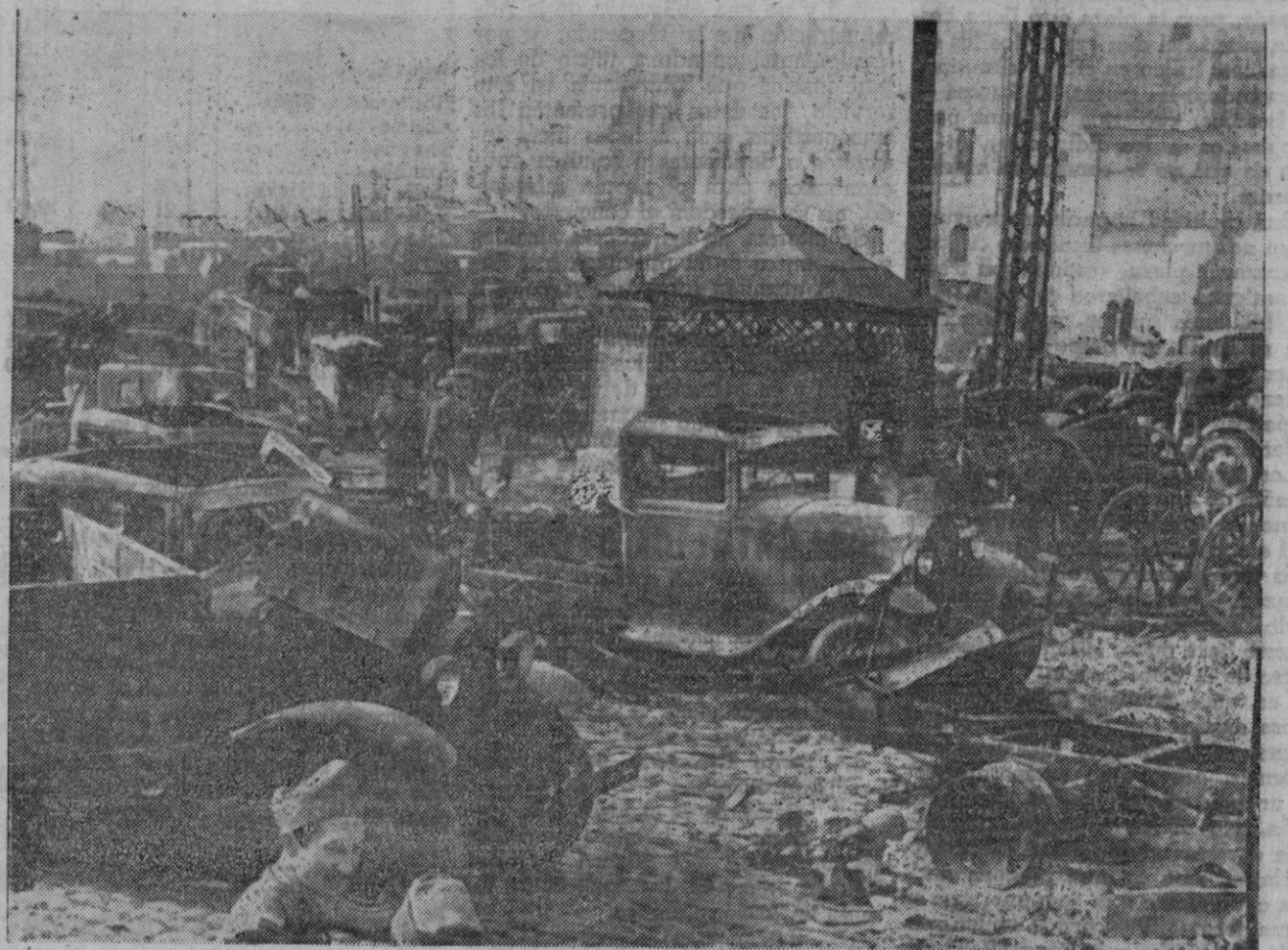
RUTA DE DERROTA DE LOS EJERCITOS SOVIETICOS.—La fotografía nos muestra una plaza de una localidad rusa ocupada por los alemanes, repleta de vehículos de todas clases abandonados por los bolcheviques en su retirada.

Continúan avanzando las tropas finlandesas