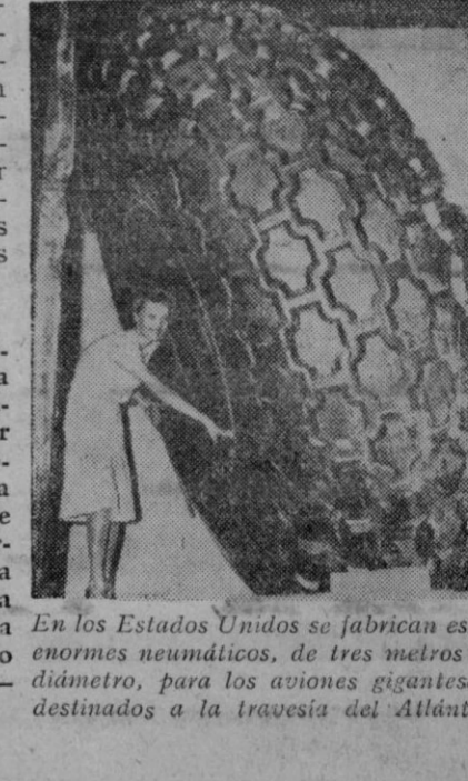
En los Estados Unidos se fabrican estos enormes neumáticos, de tres metros de diámetro, para los aviones gigantes destinados a la travesía del Atlántico