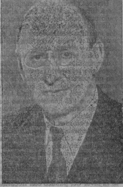
Mr. Morgenthau, ministro de Hacienda norteamericano

Nueva York, 6 (5 t.)—Morgenthau, ministro de Hacienda de Estados Unidos, ha celebrado una conferencia con los jefes de grupo del Congreso sobre la Ley fiscal de 1942 que ha de ser aprobada antes de fin de año. Al mismo tiempo el ministro ha expuesto un informe de los técnicos económicos, según el cual se ha comprobado entre los obreros y empleados norteamericanos una capacidad complementaria de compra de cinco a ocho mil millones de dólares en total, producida por el programa de armamento y que deberá ser absorbida con nuevos métodos fiscales y de tributación para evitar una inflación.—Efe.