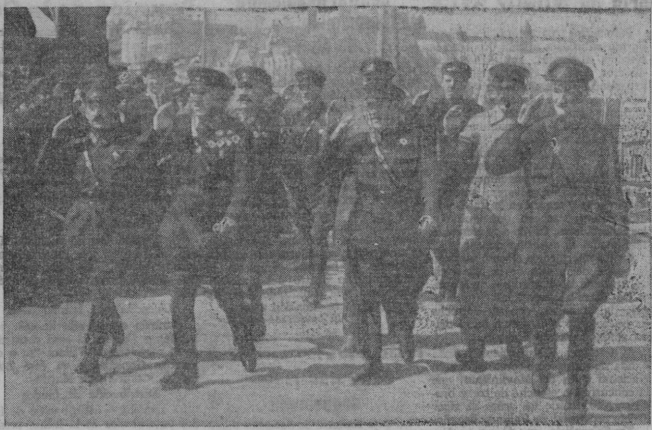
El mariscal Blucher (el segundo, contando de izquierda a derecha), jefe del ejército soviético de la Rusia oriental, aparece fotografiado durante una parada militar en Vladivostok. Como es sabido, parece que Blucher ha trasladado al frente de Moscú importantes contingentes de tropas que estaban bajo su mando para contribuir a la defensa de la capital soviética.

Ciudad Real, 6.—Recientemente, el Servicio Nacional del Trigo ha enviado a esta provincia 75 pares de mulas, que han sido repartidas por la Jefatura provincial de este Servicio entre los agricultores de la provincia. Las normas seguidas para efectuar el reparto han sido la mayor falta de ganado entre los labradores, como consecuencia de los destrozos causados en el ganado de labor en el período rojo, y la mayor superficie sembrada por cada agricultor. Los precios en que han sido adjudicadas las mulas oscilan entre 1.300 y 2.700 pesetas cada ejemplar. Se esperan nuevos envíos para que pueda elevarse el área de cultivo de esta provincia hasta superar la de épocas normales.—Logos.